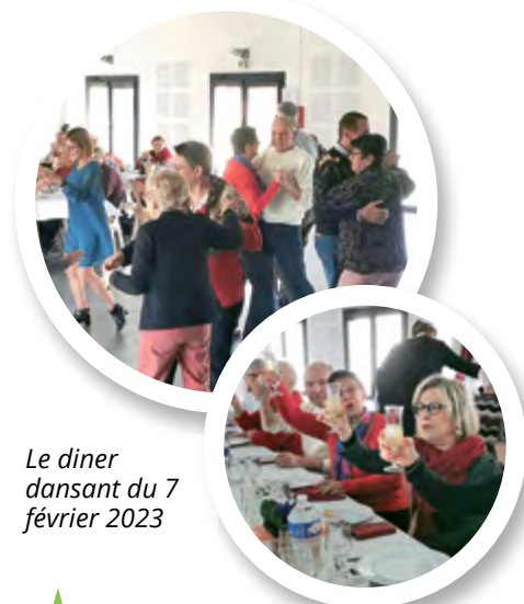
Le dîner dansant du 7 février 2023