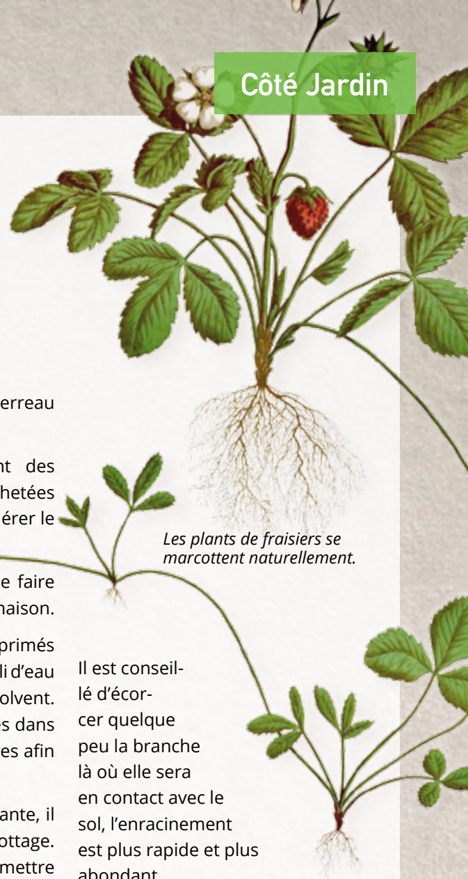
Les plants de fraisiers se marcotent naturellement.

Pour obtenir une nouvelle plante, il y a aussi la méthode du marcottage. Le marcottage consiste à mettre en contact avec le sol une jeune branche en la maintenant à l'aide de crochets ou d'une pierre plate. Le rameau n'est pas séparé du plant mère.