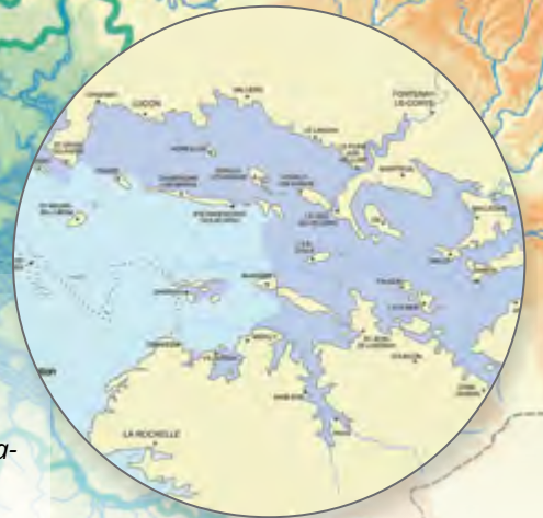
Le golfe des Pictons aux alentours du II e siècle avant Jésus-Christ.