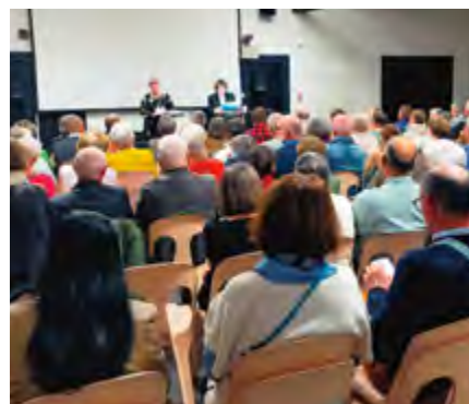
La soirée «1 livre 1 film».

vous inspire et que l'envie de joindre votre voix à celle des bibliothécaires vous dit, renseignez-vous à la bibliothèque.